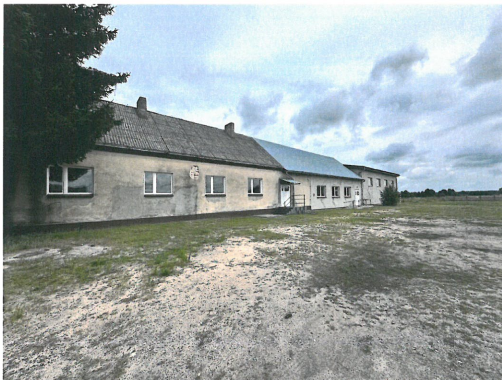
Widok z zewnątrz